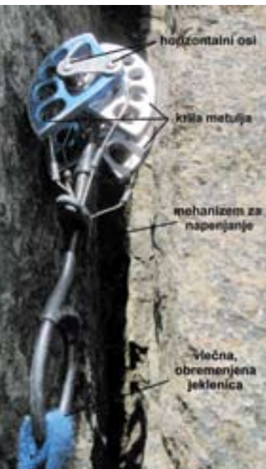
Metulj z dvema horizontalnima osema v poči.