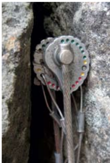
Metoliusov metulj z barvno lestvico, ki ocenjuje kakovost namestitve (zeleno dobro, rumena srednje dobro, rdeča slabo).