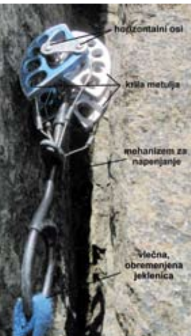
Metulj z dvema horizontalnima osema v poči.