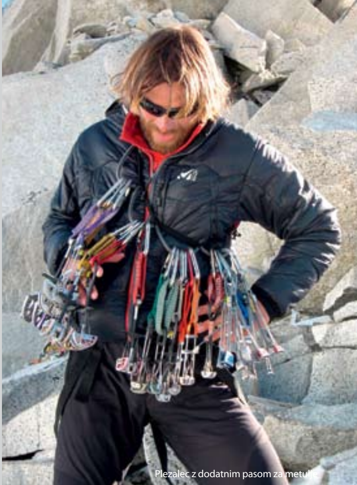
Plezalec z dodatnim pasom za metulje

Metulj v poči z obremenitvijo T in označenim kotom