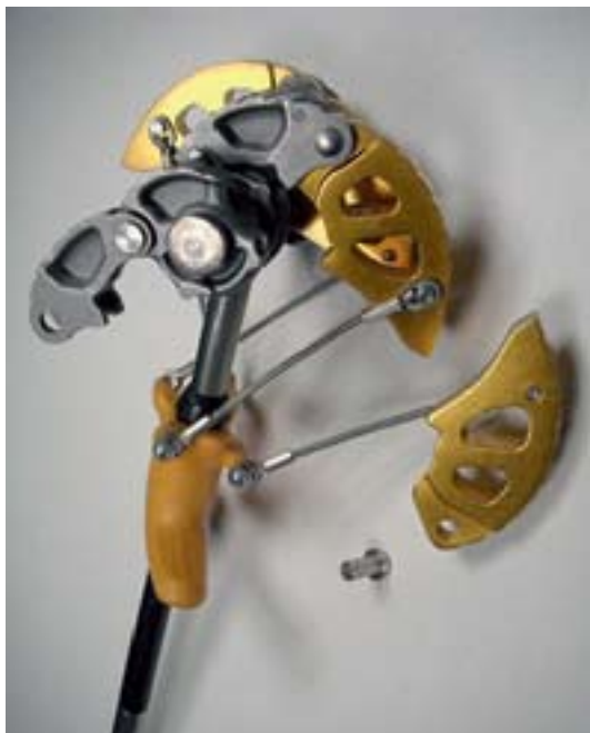
Metulj znamke Omega Pacific s pokvarjenim spojem, vir: http://www.danskbjergklub.dk/forum/

kril (stik med krili in počjo naj ne bo na vrhovih, temveč v dolinah reliefa sten poč).i).