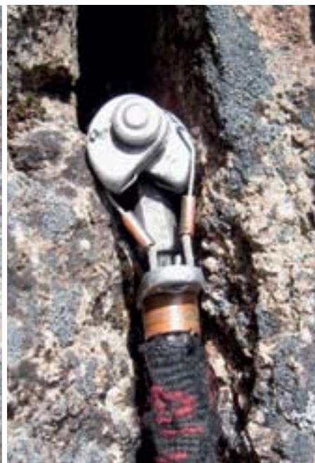
Metulj, ki je nameščen v poč kot zatič, saj se poč zoži v smeri predvidene obremenitve.

posameznega modela). Na skici (str. 65) je ta kót označen s \Theta . V tem položaju je metulj stabilneje nameščen, obenem pa je normalna sila, ki tvori trenje, še vedno dovolj velika.